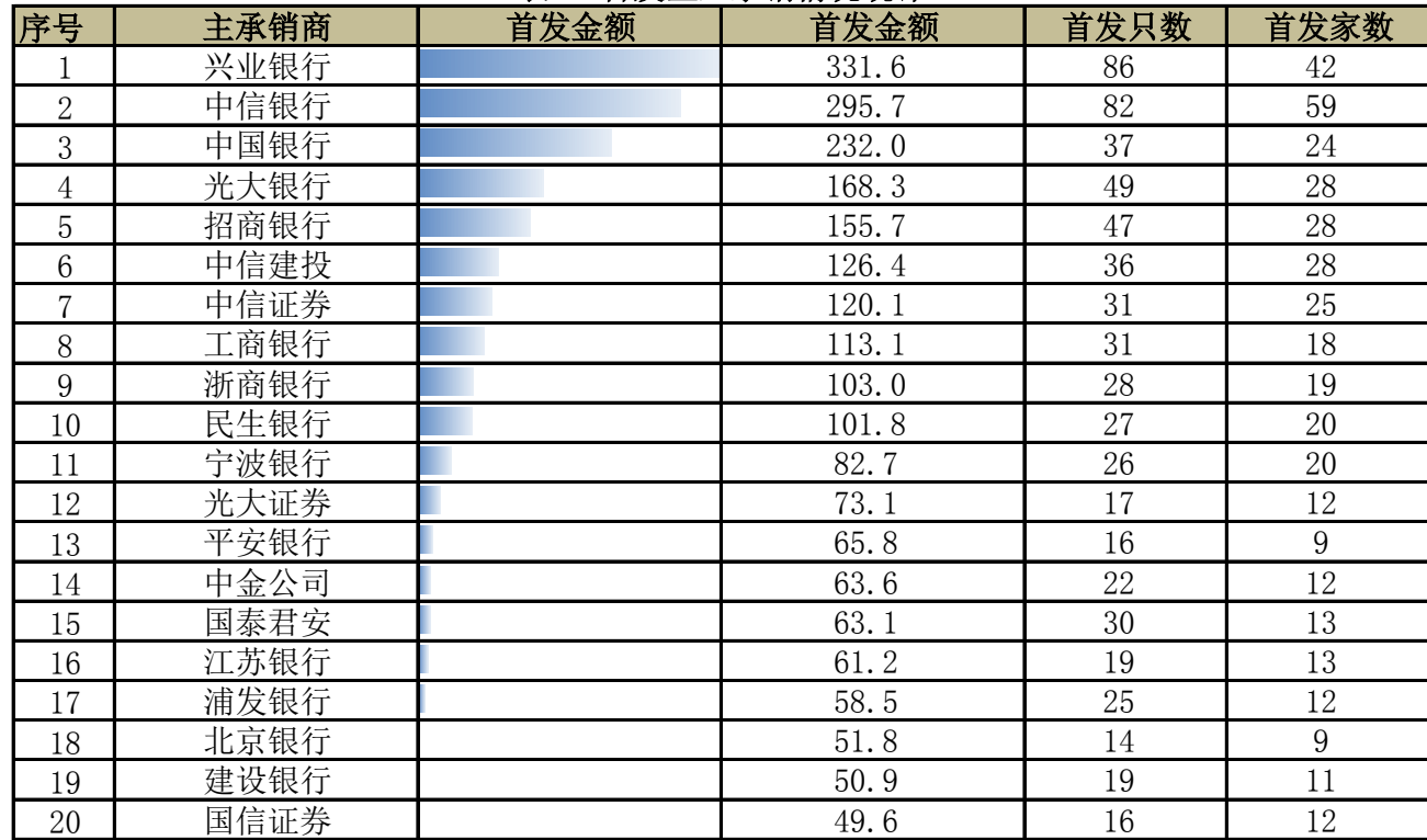
表 3 首发企业承销情况统计