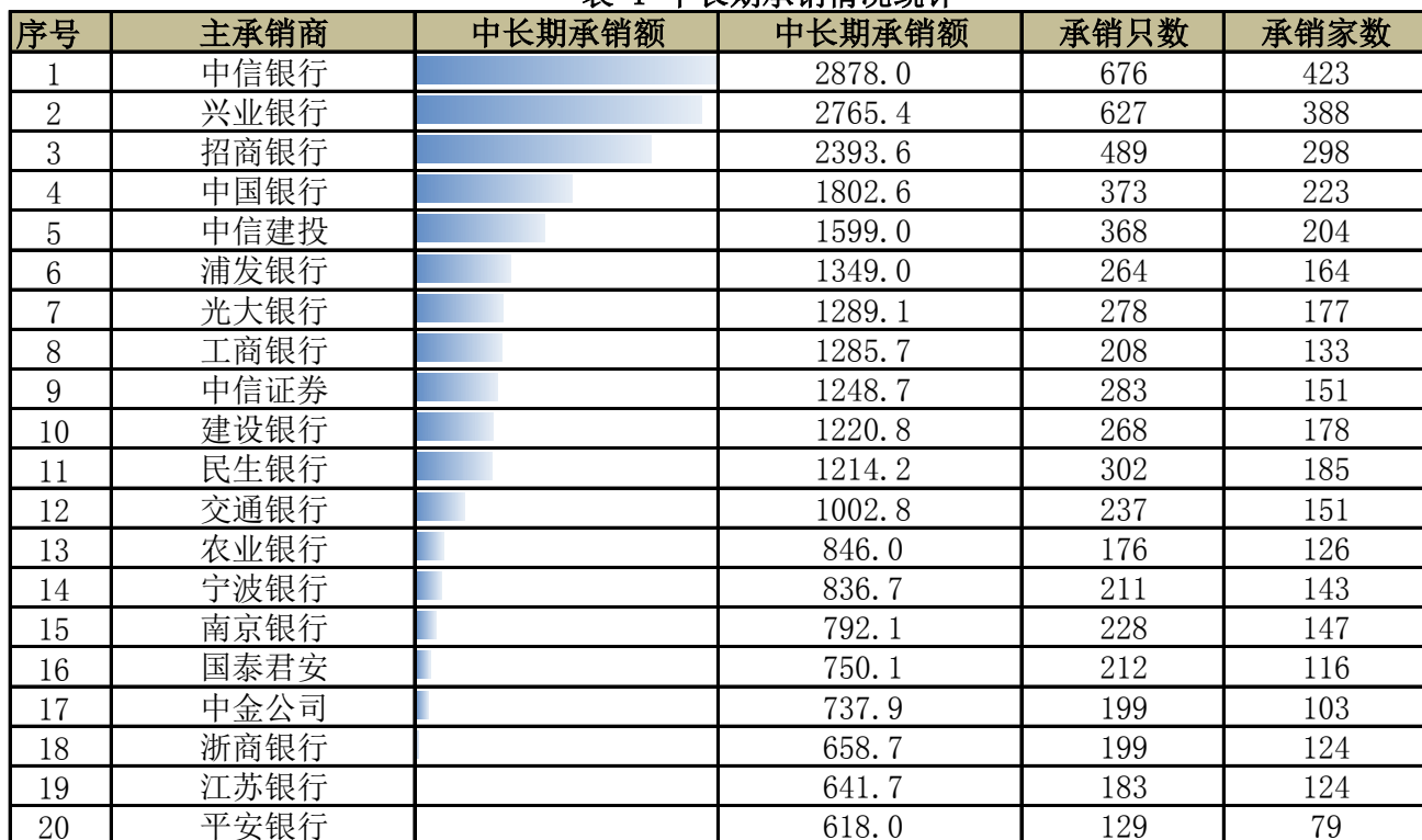
表 1 中长期承销情况统计